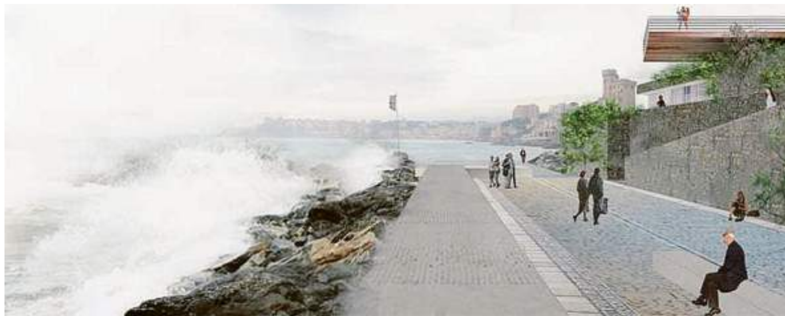
L'elaborazione grafica della nuova terrazza sul mare che sorgerà dopo i lavori di fronte al monumento ai Mille di Quarto

Travagliata, travagliatissima, la storia del Monumento di Quarto. Un primo obelisco commemorativo venne inaugurato il 5 maggio 1861. Garibaldi con i suoi Mille, partiti dallo scoglio di Quarto nella notte del 5 maggio 1860 su due vapori della Società Rubattino, il Piemonte e il Lombardo (il grosso dei volontari in realtà si imbarcò dalla Foce), dopo una breve sosta a Talamone, in Toscana, l'11 maggio 1860, sfuggiti alla caccia della flotta borbonica, approdarono di sorpresa nel porto di Marsala. Il secondo grande monumento fu inaugurato da Gabriele D'Annunzio il 5 maggio del 1915, vigilia dell'entrata in guerra dell'Italia. Prima concessi e poi ritirati, i fondi ministeriali per il restauro sono stati ripristinati poche settimane fa. Oggi la ripresa del cantiere, che prevede la pedonalizzazione della piazzetta del