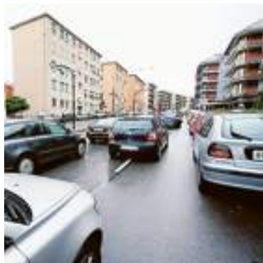
Traffico bloccato in corso Europa

Risultato: la paralisi. Che è durata a lungo. Con attese estenuanti a bordo dei mezzi. Naturalmente accesi, tanto all'ambiente e al consumo di carburante si penserà un'altra volta.