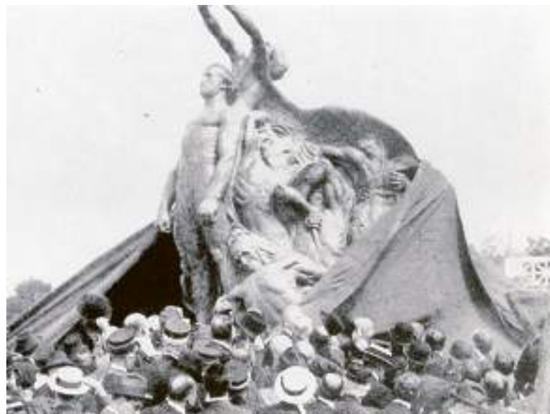
La cerimonia a Quarto del 5 maggio 1915: il drappo rosso viene calato

gnecco@ilsecoloxix.it © RIPRODUZIONE RISERVATA