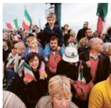
Famiglie in attesa a Quarto