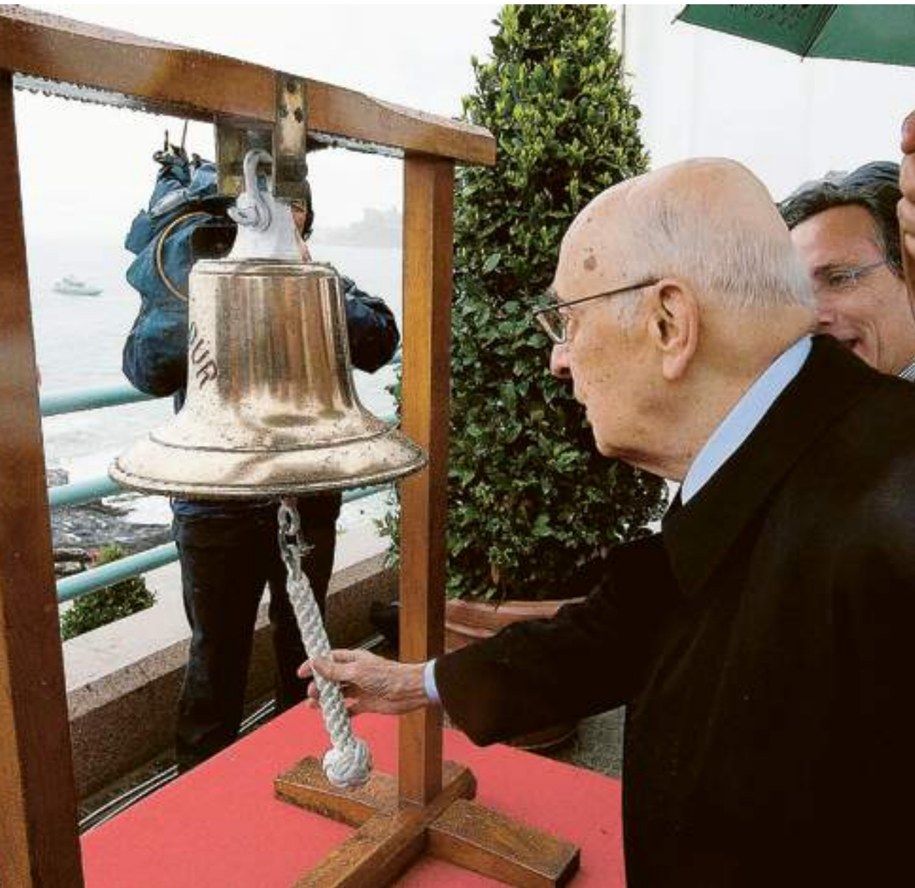
Il presidente Napolitano dà il segnale di partenza della regata storica che ricorda la spedizione dei Mille