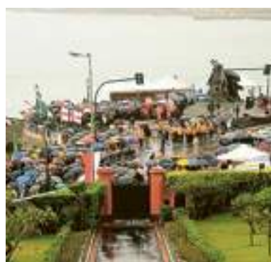
Piazza Crispi "coperta" di ombrelli