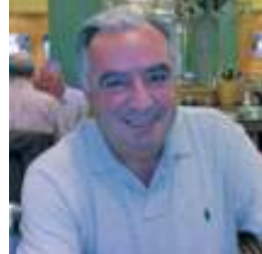
Proposto da Voltri, chirurgo del San Martino