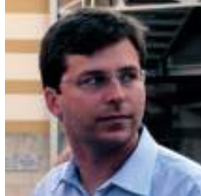
Segretario regionale del PD e consigliere regionale uscente