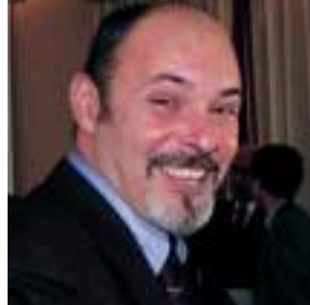
Presidente Municipio Medio Ponente