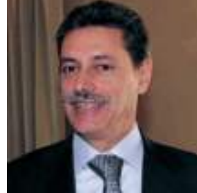
Valpolcevera assessore uscente