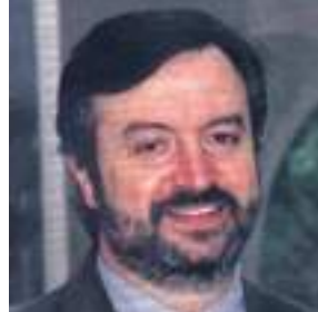
Valle Stura, ex sindaco di Campoligure