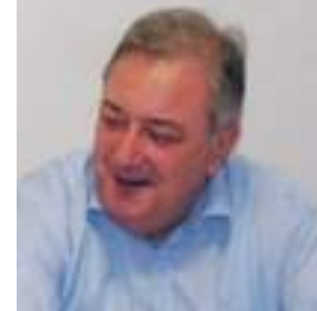
Ex assessore regionale, coordinatore circoli Ponente