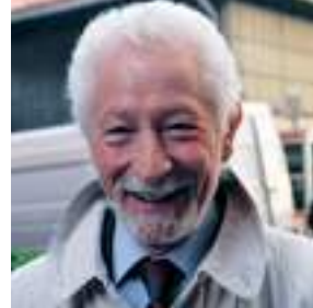
Consigliere comunale di Genova