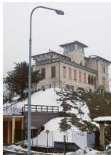
Villa Bagnara a Masone