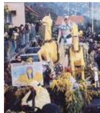
La Sagra della mimosa

Si inizierà già al mattino con l'esposizione proprio nel piazzale San Michele di bancarelle, stand, esposizione dei quadri fioriti realizzati dagli alunni della scuola medie dell'asilo. Gli stand gastronomici alle 11.30 a base di focaccine dolci e salate. L'attesa benedizione della mimosa è fissata per le 12. La distribuzione inizierà alle 14.30, con l'utilizzo della celebre stafia, la funicolare che veniva usata all'inizio del Novecento. In attesa della sfilata dei carri fioriti allegorici, si esibirà al pomeriggio la fanfara dei bersaglieri del reparto maggiore Pietro Triboldi di Cremona. Dal mattino un trenino su gomma porterà lungo le vie del paese. Funzionerà il servizio navetta dalla stazione Fs.