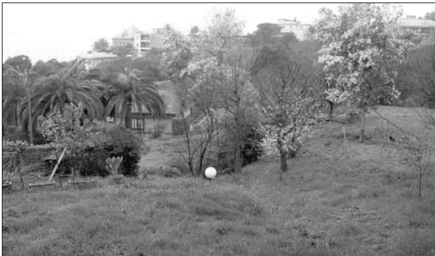
Edoardo Meoli L'area di viale Quartara interessata dall'intervento edilizio: una lottizzazione contestata dai residenti

to metri quadrati), prevista sopra lo stesso civico 7 del viale, all'interno di un terreno, che una volta ospitava un'attività di floricoltura. Il terzo intervento, che è anche il meno contestato, riguarda la ristrutturazione di un edificio a tre piani, oggi abitato solo da un custode: poco più di settecento metri quadrati. La superficie totale dei tre interventi è, dunque, più o meno di mille settecento metri quadrati, che tradotti in termini squisitamente commerciali, rappresentano un affare da otto milioni e mezzo di euro, sempre tenendo per buono il valore immobiliare di 5 mila euro al metro quadro. Ovviamente i costruttori dovranno pagare i lavori e gli oneri di urbanizzazione, ma l'impressione è che in tasca possano restare un bel po' di quattrini. «È un affare colossale, anche perché qui non si costruisce da decenni, visto che la zona è considerata di pregio dallo stesso piano territoriale di coordinamento - aggiungono i contestatori - purtroppo il Comune sembra intenzionato a dare il via libera, in cambio di una decina di parcheggi pubblici, che, tra le altre cose, non servono a niente perché qui i posteggi non mancano».