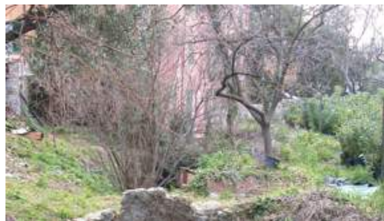
Area di nuove costruzioni a Quarto in via Antica Romana della Castagna