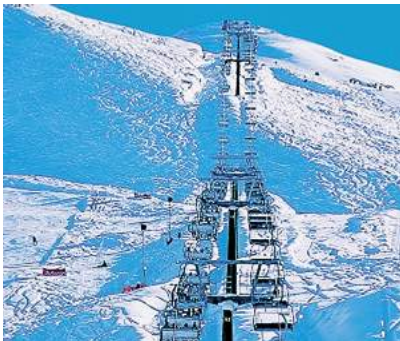
Il "Blu", uno degli impianti di risalita di Prato Nevoso

I soccorsi sono partiti immediatamente: pochi minuti dopo la telefo-