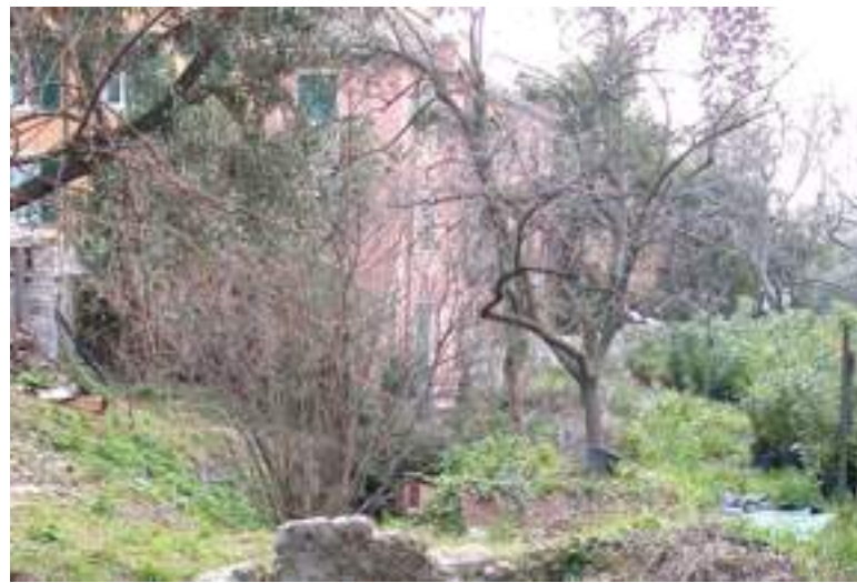
L'area della Castagna interessata all'intervento edilizio