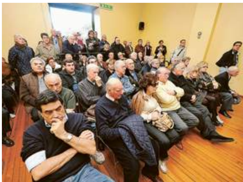
Un'assemblea degli abitanti di via Shelley lo scorso aprile