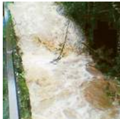
Il rio Penego in piena