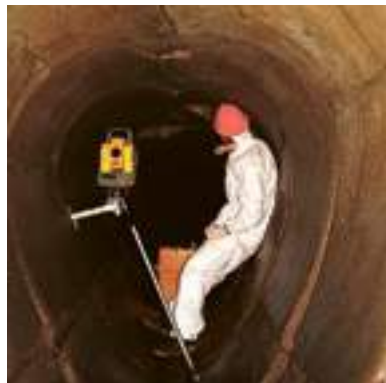
Un operaio al lavoro

Russo, nella missiva di inizio estate, chiede a Palazzo Tursi «in maniera tassativa» di portare a termine entro il 30 luglio una serie di adempimenti finalizzati alla costruzione della strada. Il