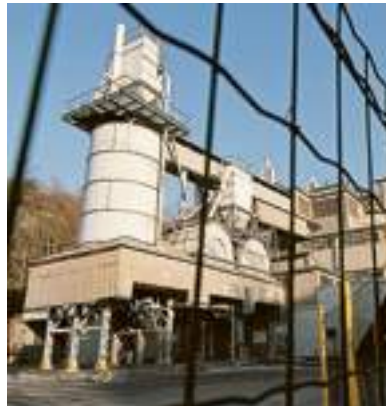
L'area Italcementi di Ponte Carrega

«Lavorare qui era diventato impossibile - ammette un funzionario di Italcementi che chiede l'anonimato - Non potevamo fare nessun lavoro di ammodernamento; ci volevano decine di permessi, facevano controlli sui controlli ed era una situazione invivibile. Ogni tanto venivano anche le associazioni ambientaliste per denunciare inquinamenti, ma qui non