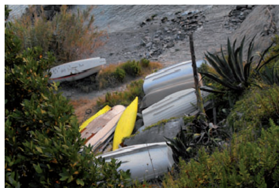
DEGRADO e abbandono a Quarto. I cittadini attendono risposte concrete dal Comune