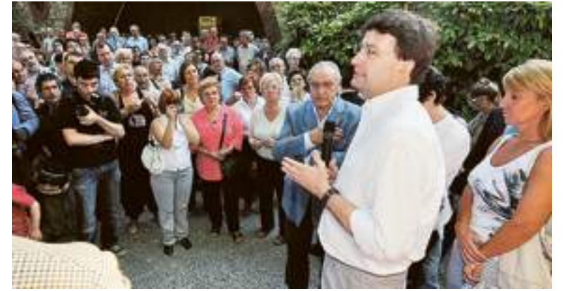
Il segretario del Pd Dario Franceschini