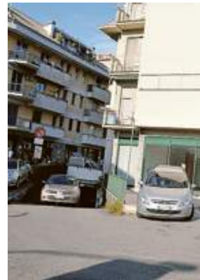
Il punto di innesto con corso Europa