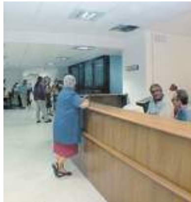
La sede Inps di via D'Annunzio