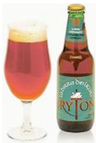
La birra Bryton